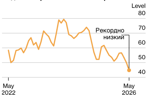
Индекс потребительских настроений